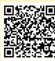
「ラーケーションの日」保護者用リーフレット