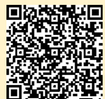
「ラーケーションの日」ポータルサイト